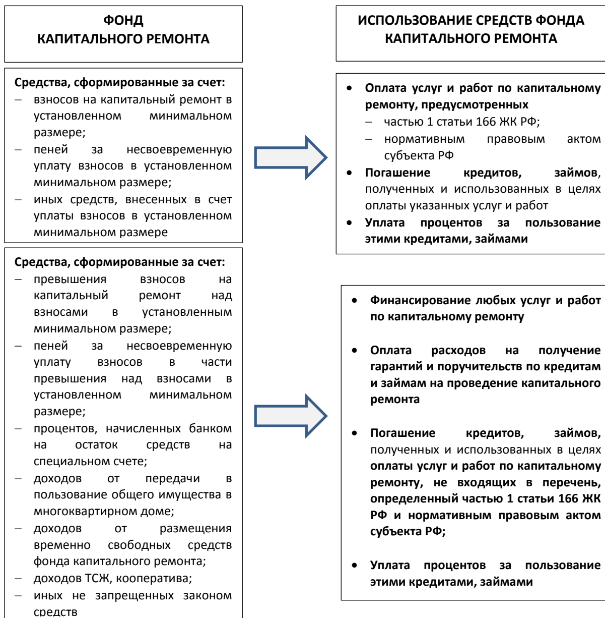
Схема 1. Использование средств фонда капитального ремонта для финансирования услуг и работ по капитальному ремонту