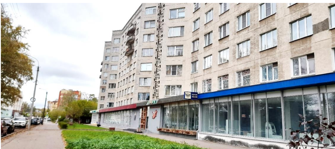
Фото 1 – 2. МКД по адресу Кострома, площадь Мира, дом 2.