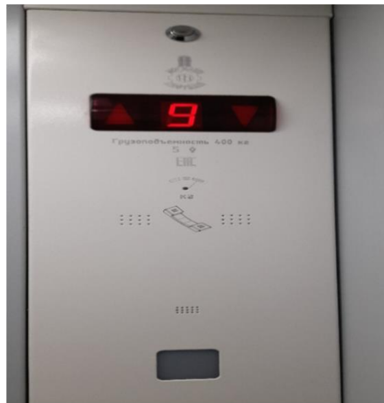
Фото 3 – 4. Новые лифты МКД по адресу площадь Мира, дом 2.

Жители дома издавна испытывали проблемы с теплоснабжением, причина которых заключалась в конечном положении дома на тепловых сетях, идущих от источника генерации тепловой энергии. При любых порывах на тепловых сетях дом отключали от теплоснабжения. Постоянные отключения тепла побудили собственников помещений задуматься о переустройстве системы теплоснабжения дома. После многократных обсуждений собственниками помещений в доме было принято решение о строительстве крышных газовых котельных. Была разработана проектно-сметная документация, управляющая организация нашла подрядчика, и в мае 2021 года начались строительные-монтажные работы. Стоимость работы составила 15 млн руб., из них 7 млн руб. были оплачены за счет средств на специальном счете, а на 8 млн руб. подрядчик предоставил рассрочку сроком на 1 год. Для обеспечения расчетов с подрядчиком решением общего собрания установили дополнительный взнос на капитальный ремонт в размере 31,18 руб. с 1 кв. м, в июне 2022 года собственники внесли его в последний раз.