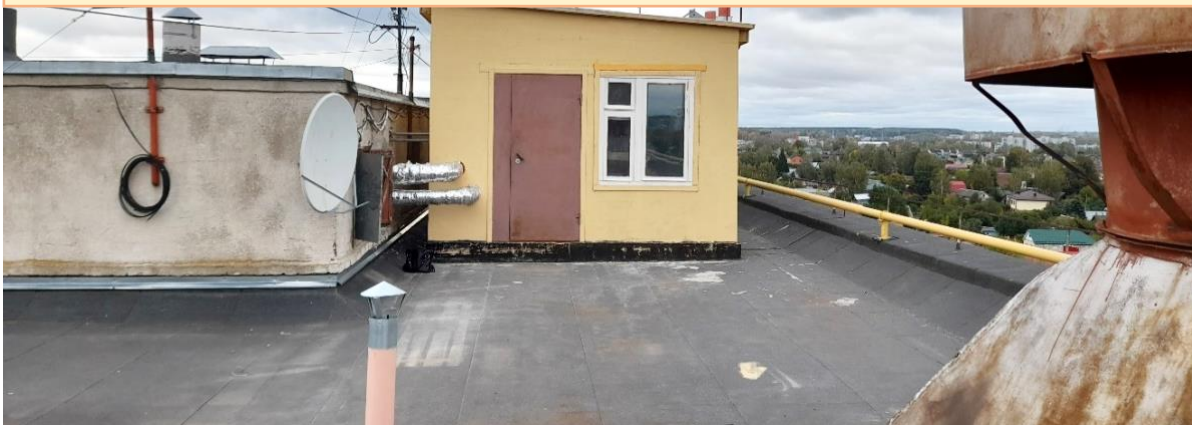
Фото 5. Газовая котельная на крыше МКД по адресу площадь Мира, дом 2.

Проект обустройства крышной котельной в многоквартирном доме в Костроме является пилотным. Ранее в России не было опыта обустройства газовой котельной в существующем доме.