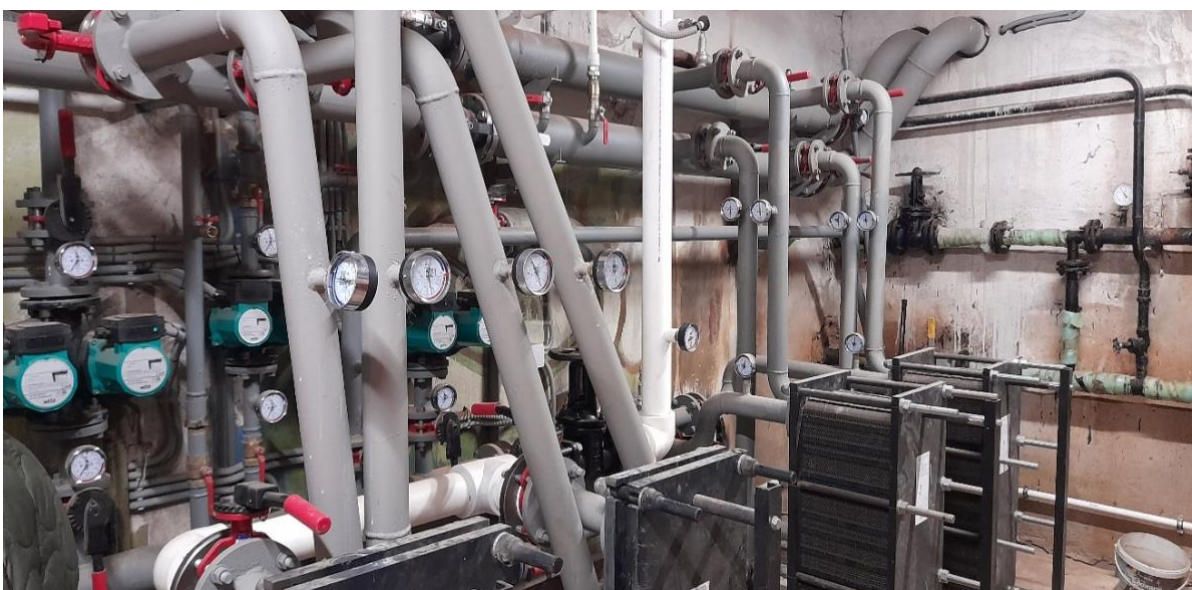
Фото 6. Тепловой узел в подвале МКД по адресу площадь Мира, дом 2.

В целом реализация этого проекта начиная с первого проявления инициативы и принятия решений собственниками помещений в доме о капитальном ремонте, с учетом подготовительных работ, согласований, подготовки проектной документации и строительства заняла 5 лет. Теперь этот дом всегда с горячей водой, а в квартирах комфортная для проживания температура. После установки крышной котельной плата за отопление с 25