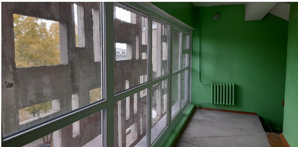
Фото 7. Новое остекление лестничных площадок в МКД по адресу площадь Мира, дом 2.

Мероприятия по энергосбережению и повышению энергетической эффективности в доме решаются комплексно. Во всех подъездах установлены светодиодные светильники, с датчиками движения, у подъездов – с датчиками света. Старые окна в трех подъездах заменены на пластиковые окна со стеклопакетами (фото 7).