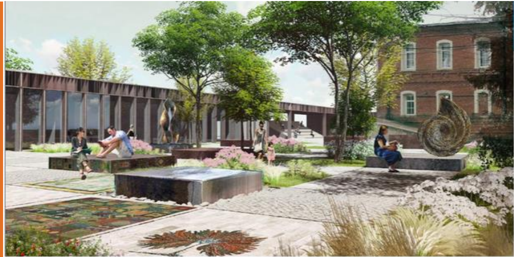
Парк Искусств Таруса Калужская обл.