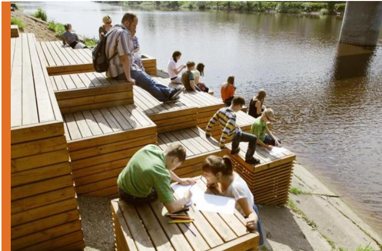
Красный пляж Вологда

Знаковые, но не обязательно большие публичные пространства могут стать заметными и понятными горожанам «островками» новой городской среды.