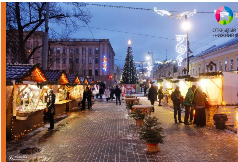
Рождественская сторона Нижний Новгород

Вопрос создания комфортной городской среды заключается, в значительной степени, в создании для людей возможности оказывать друг другу разного рода услуги и сервисы.