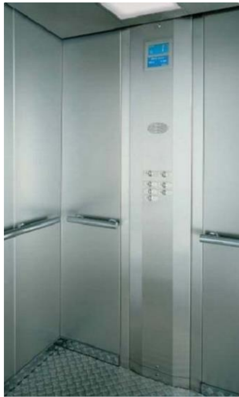
Лифт марки OTIS 2000R