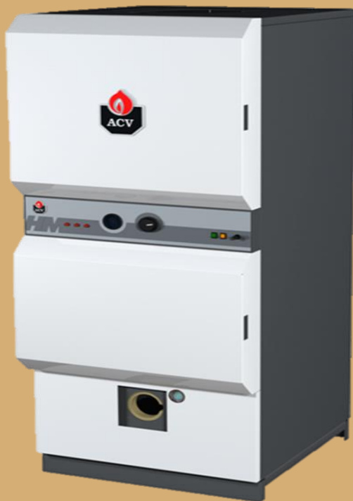
Газовый котел ACV HM-100 (Бельгия), установленный в многоквартирном доме

Установив новый газовый котел собственники получили: