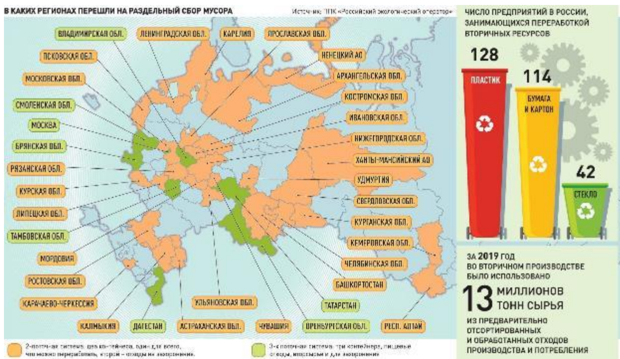
Рисунок 1 – Субъекты Российской Федерации, в которых организован раздельный сбор ТКО