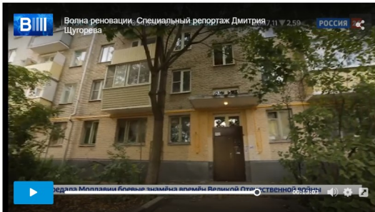
Автор: Косарева Надежда Борисовна Структурное направление: Рынок недвижимости Тема: Жилищная политика