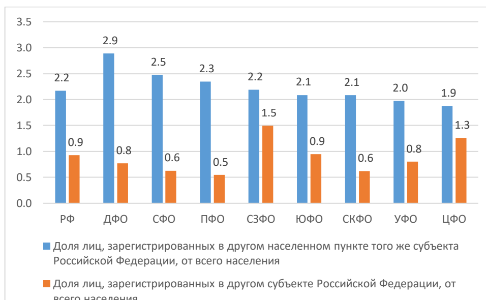
Рисунок 3 – Распределение федеральных округов по доле жителей, зарегистрированных в другом населенном пункте того же субъекта Российской Федерации или в другом субъекте Российской Федерации, от всего населения, по данным ВПН-2010, %

Федерации, первые два места занимают Северо-Западный и Центральный федеральный округа.